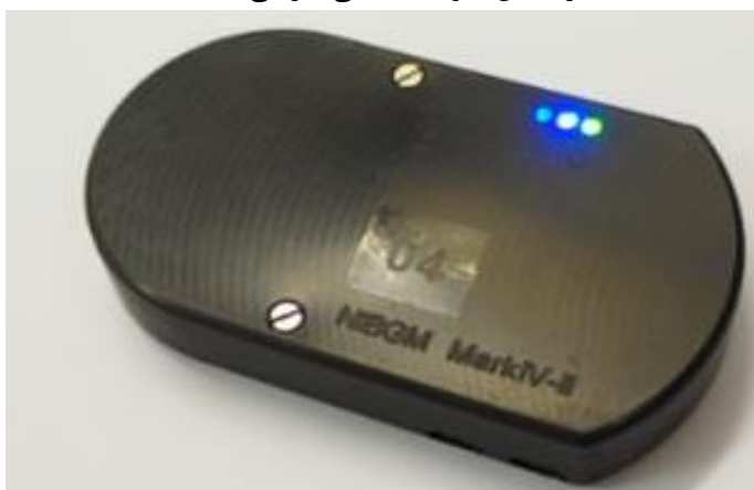
شکل ۲: دستگاه تست گلوکز خون بدون استفاده از نمونه‌ی خونی

دستگاه دیگری که به تازگی در مرحله‌ی آزمایش قرار گرفته است، دستگاه تست گلوکز خون بر اساس امواج میکروویو است (Cardiff University, 2016). شکل ۲ نمونه‌ی نهایی این دستگاه است که به دلیل تجاری بودن مکانسیم اثر این دستگاه عنوان نشده است. البته لازم به ذکر است که دستگاه بر اساس نمونه‌ی انسانی کار می‌کند